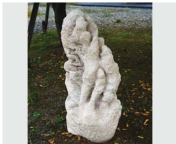
砂岩と共に去りゆく 2010

1984年 岐阜県出身 東京藝術大学大学院芸術専攻美術教育研究室博士後期課程在籍