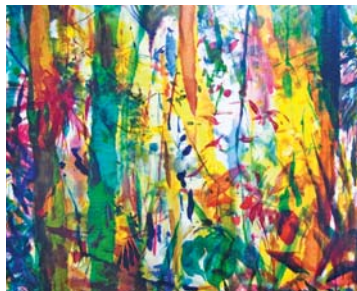
外国のジャングル 2010

1978年 京都府出身 東京藝術大学大学院美術研究科美術専攻先端芸術表現領域在籍