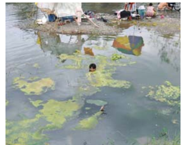
I am here 2010