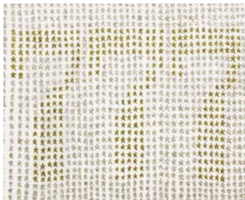
アンラッキースリーセブンスター 2009