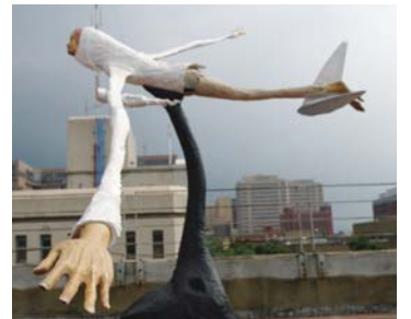
self portrait: Airplane: Come fly with me 2009