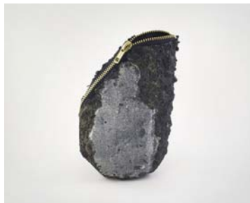
Cloth of the Earth 2009-2010