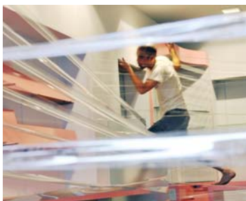
ピンク、桃、マゼンタ、紫 2010

1984年 神奈川県出身 東京藝術大学大学院美術研究科先端芸術表現専攻修士課程修了