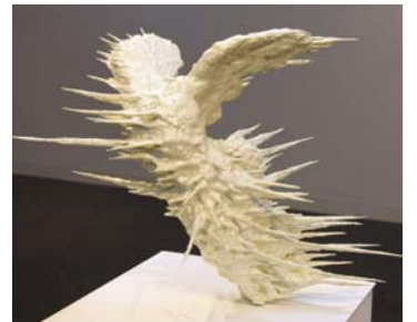
rpm500 [Victoire de Samothrace] 2010