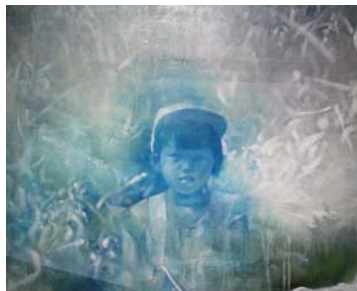
memories '94 2010