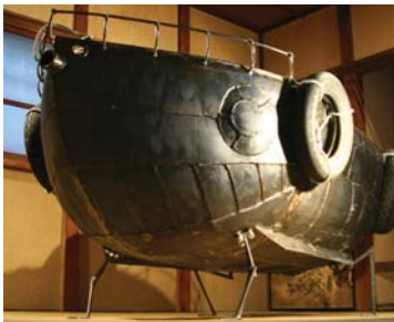
メタリックガマ号 2009